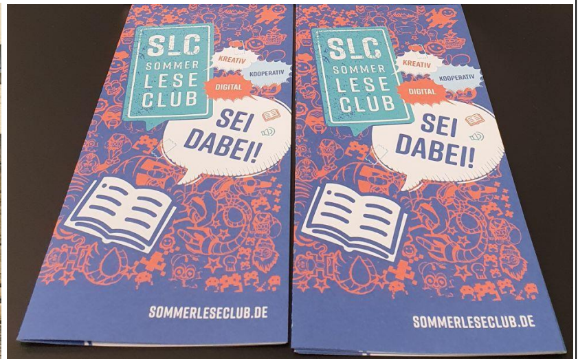
Maryam Alizadeh / Stadtteilbibliothek Freisenbruch