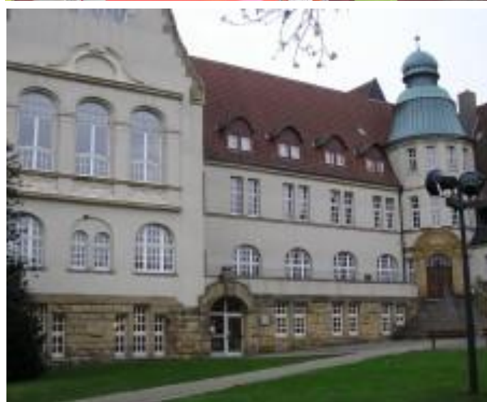
Maryam Alizadeh / Stadtteilbibliothek Freisenbruch