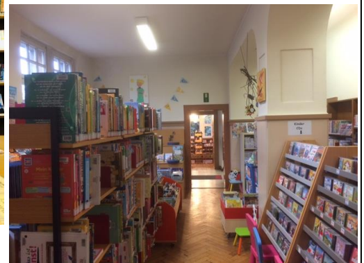
Maryam Alizadeh / Stadtteilbibliothek Freisenbruch