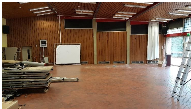
Saal (ohne Bühne)